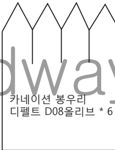
카네이션 봉우리 디펠트 D08올리브 * 6